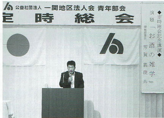
青年部会定時総会 記念講演