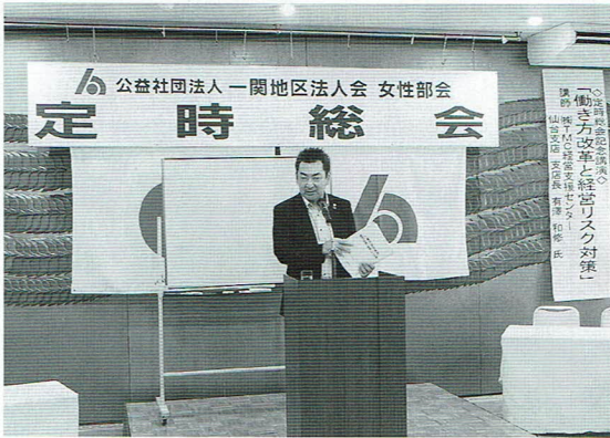
女性部会定時総会 記念講演