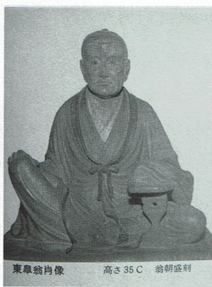
東臯翁肖像 高さ35C 翁朝盛刻