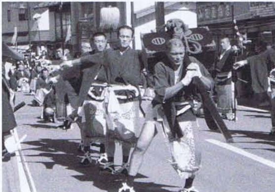
9月16日、18年ぶりに開催した「大原先陣行列」