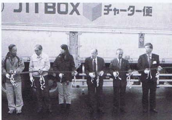
12月7日、800を超える“ふるさとの味と香り”を「第33回大東うぐいす便出発式」