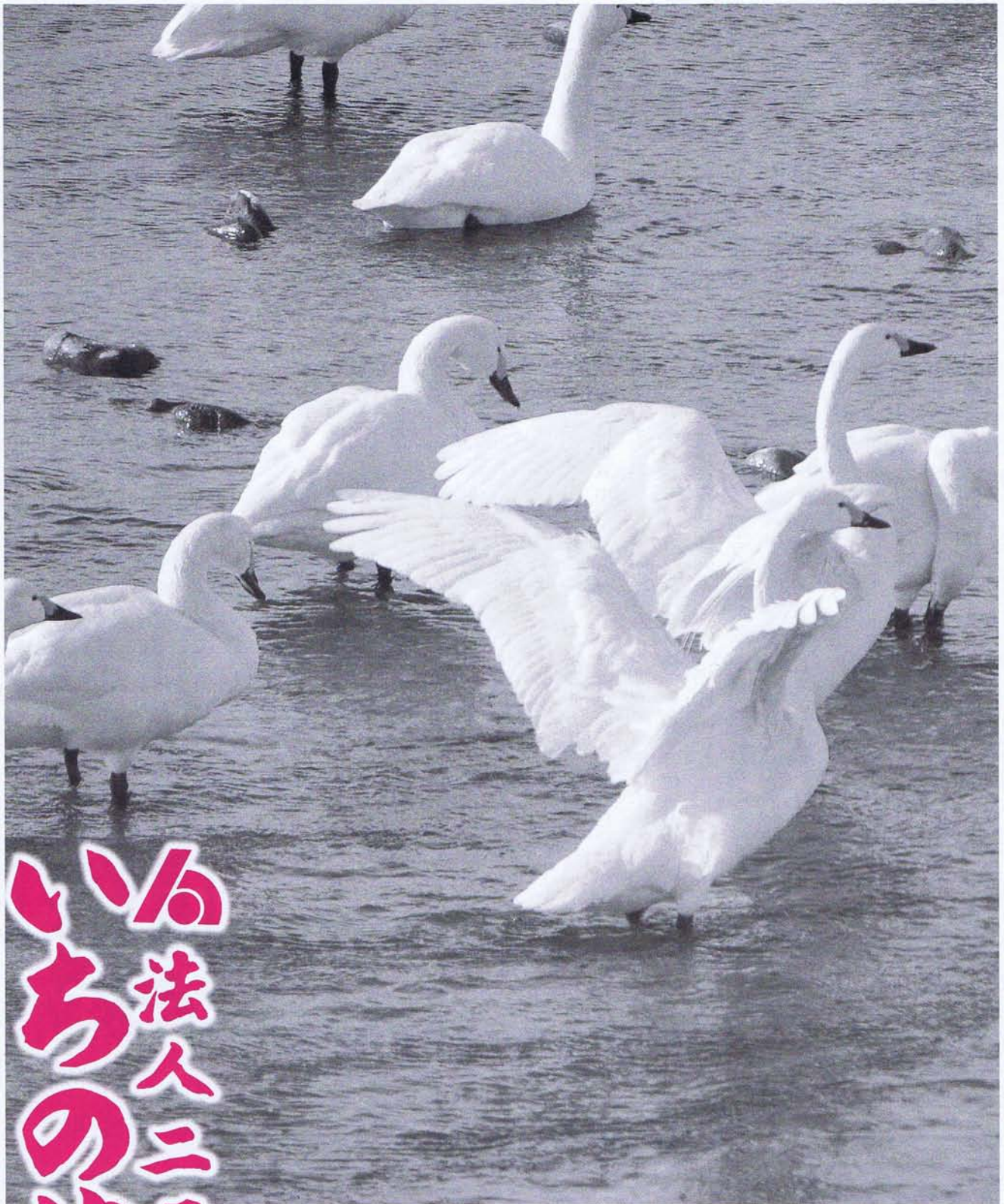
磐井川の白鳥