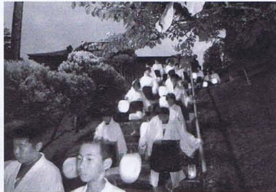
8月15日、夏の風物詩「摺沢あんどん祭り」