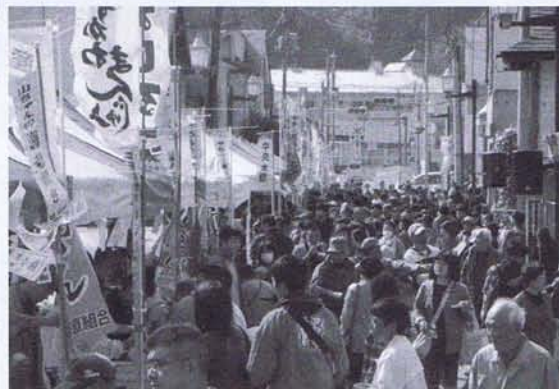
10月21日、今年も大盛況の「ご当地グルメin大東」